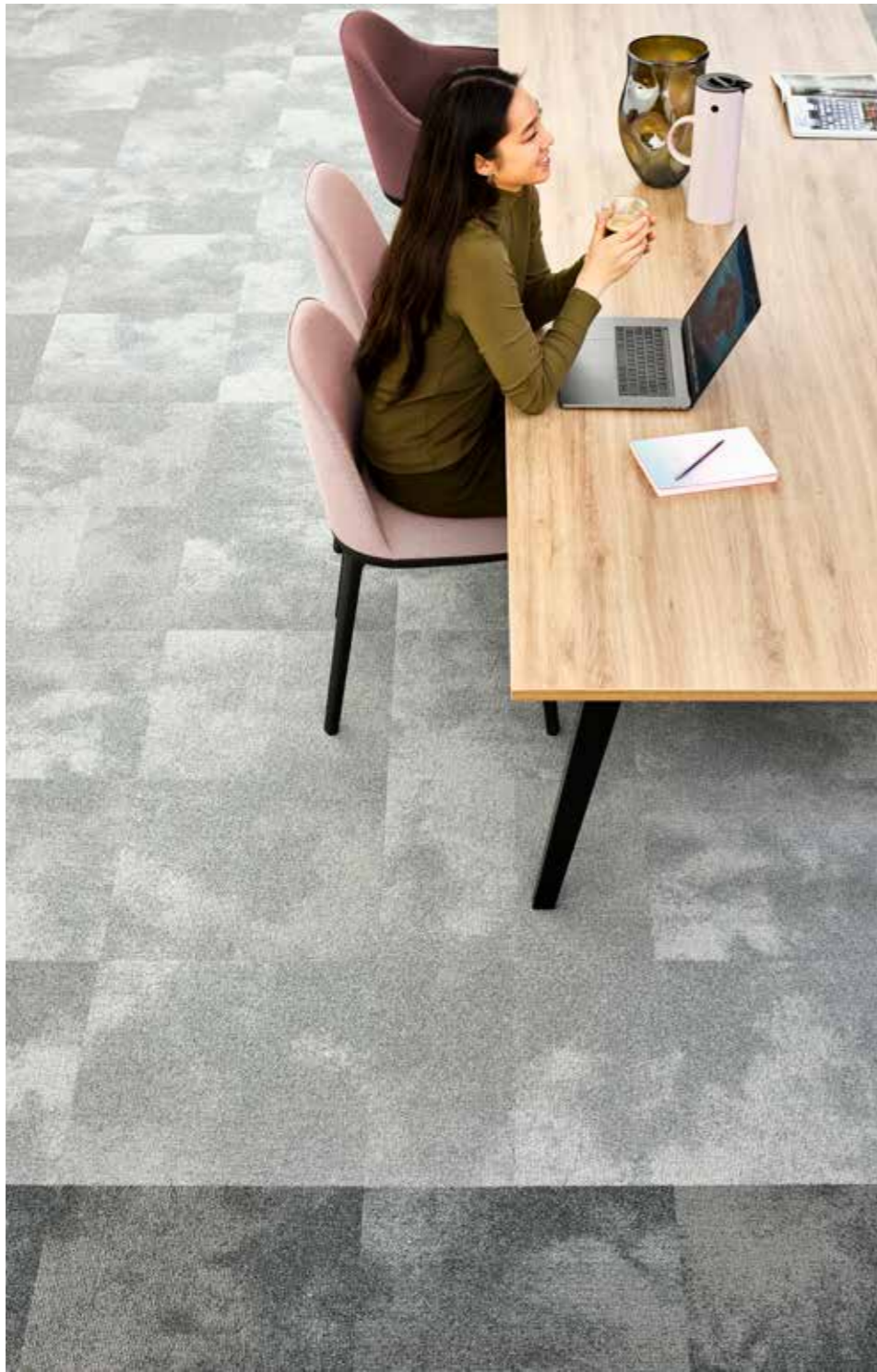
Serene 9960, 9935