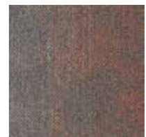
Serene Colour 5031