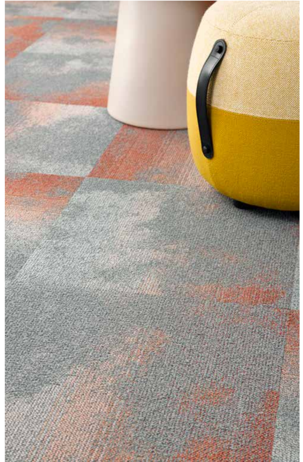
Serene Colour 5031