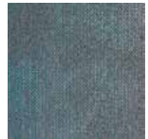
Serene Colour 8214