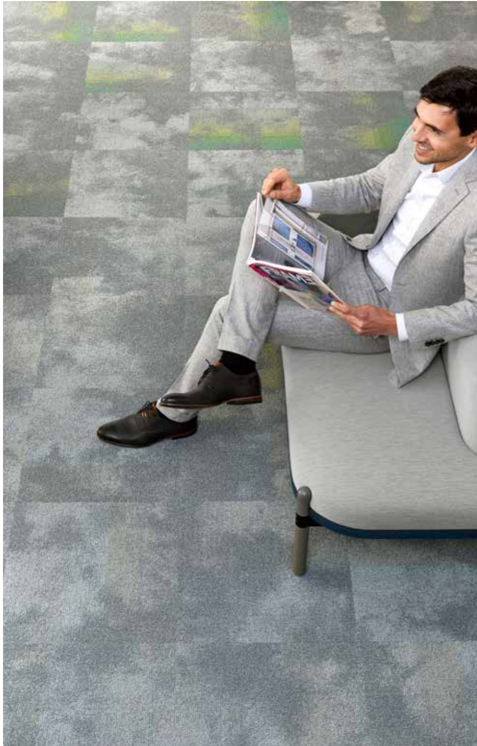
Serene 9035, Serene Colour 7373