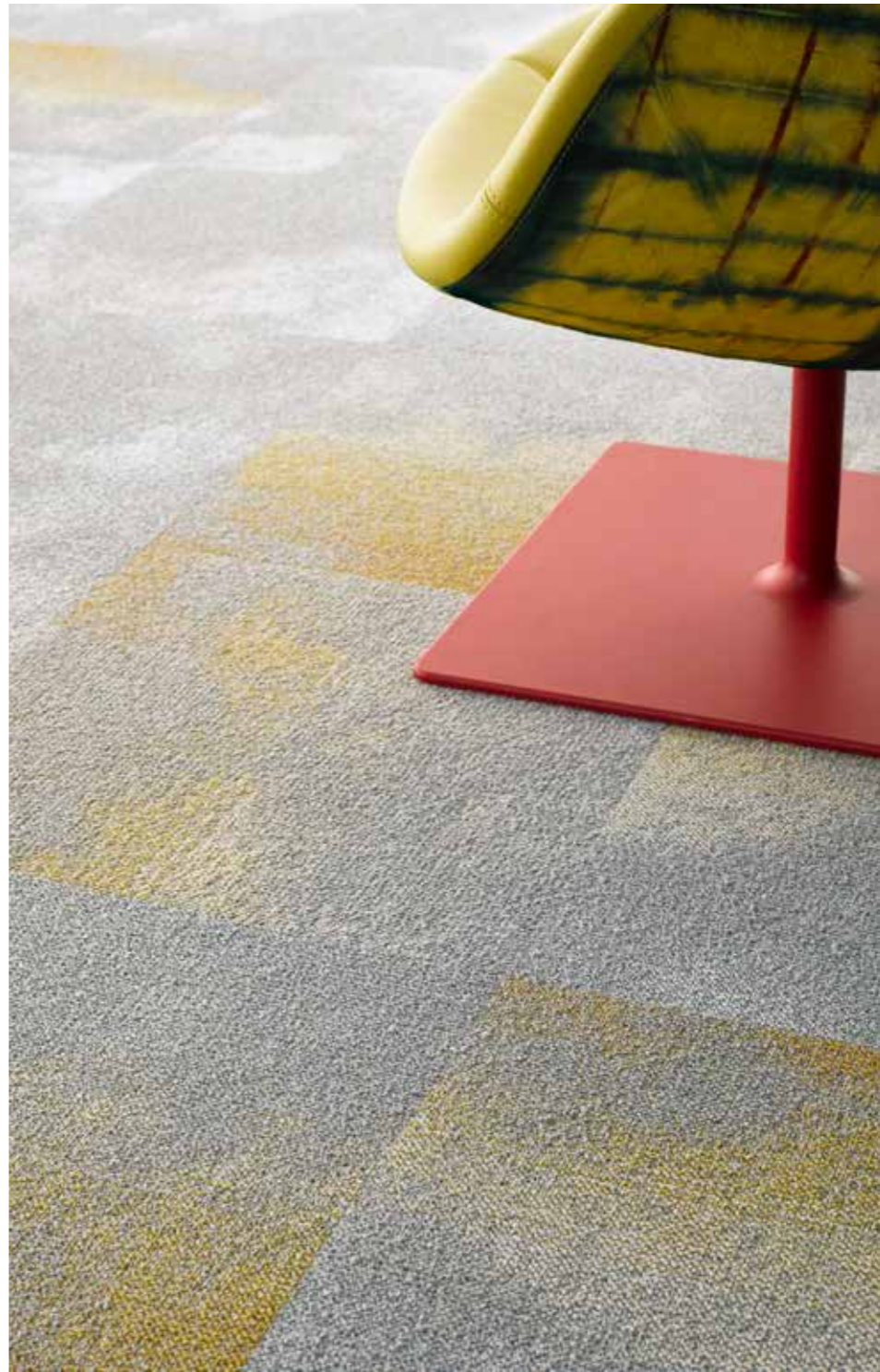
Serene 9526, Serene Colour 6113