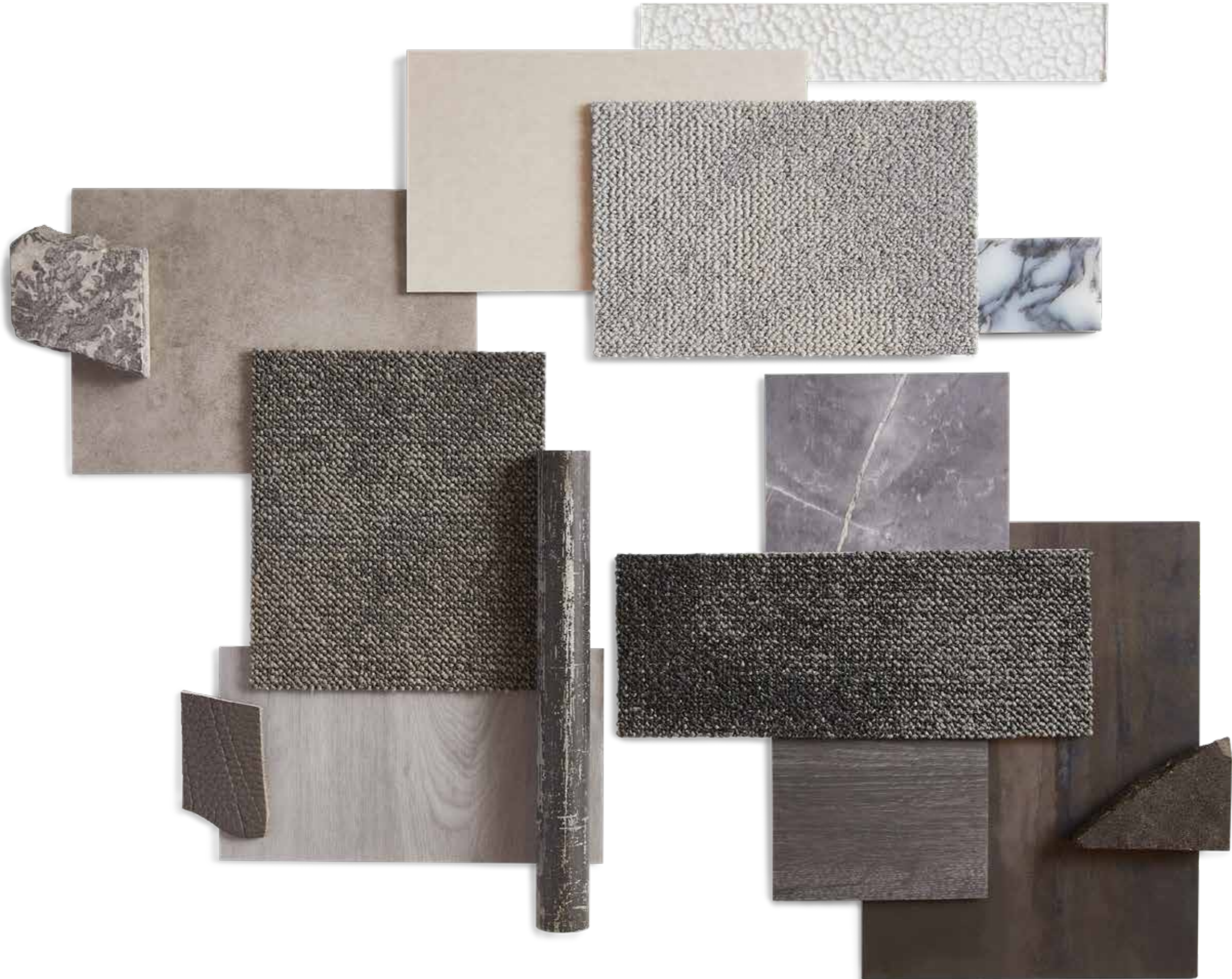
Serene 9850, 9960, 9935, ID Square chambray grey beige 24563082, ID Square cement dark gray 24563093, ID Square english oak grey 24576303, ID Square marble pulpis golden black 24565077, ID Square english oak black 24576300