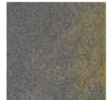
Serene Colour 6102