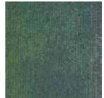
Serene Colour 7373