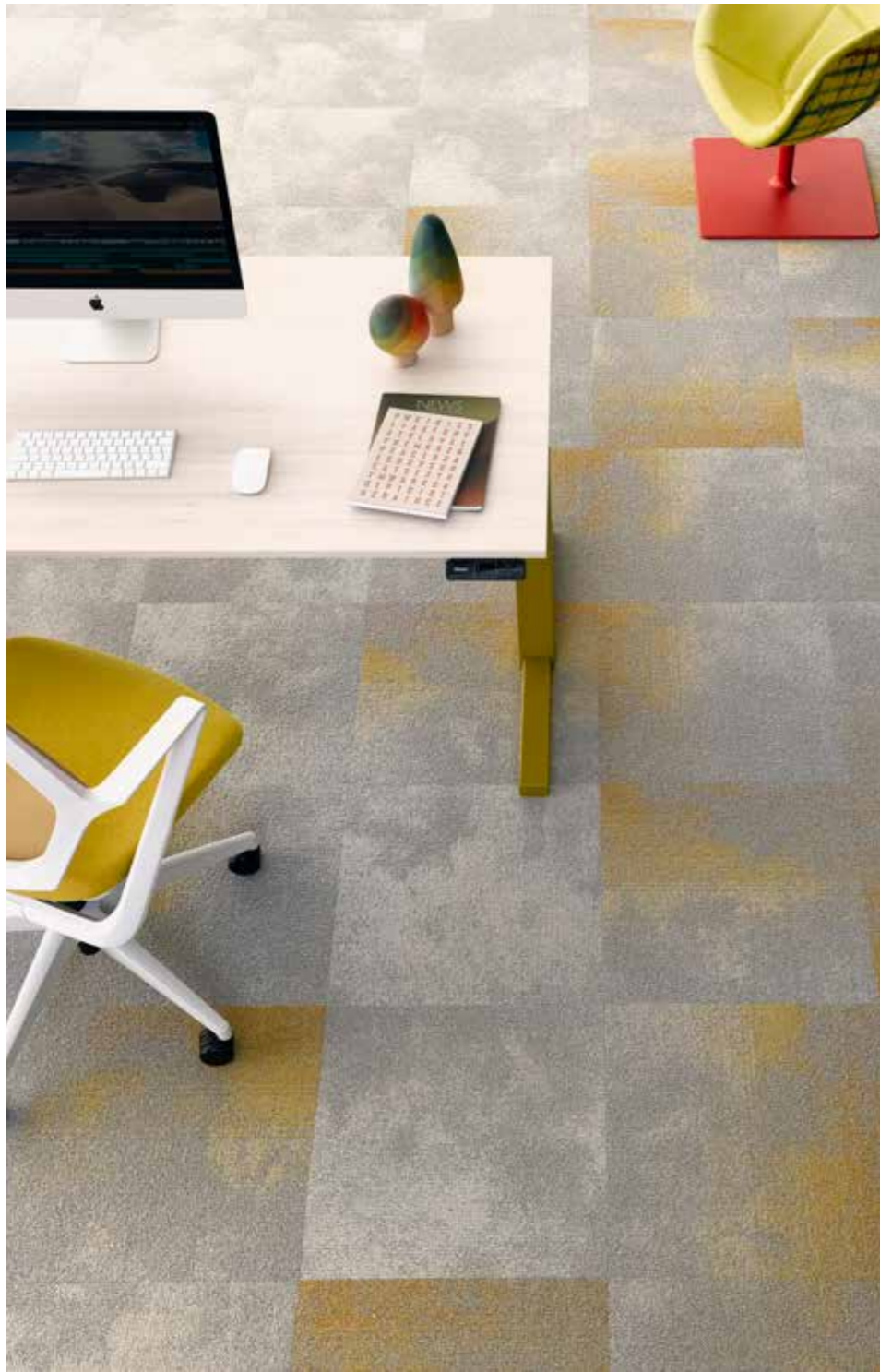
Serene 9526, Serene Colour 6113