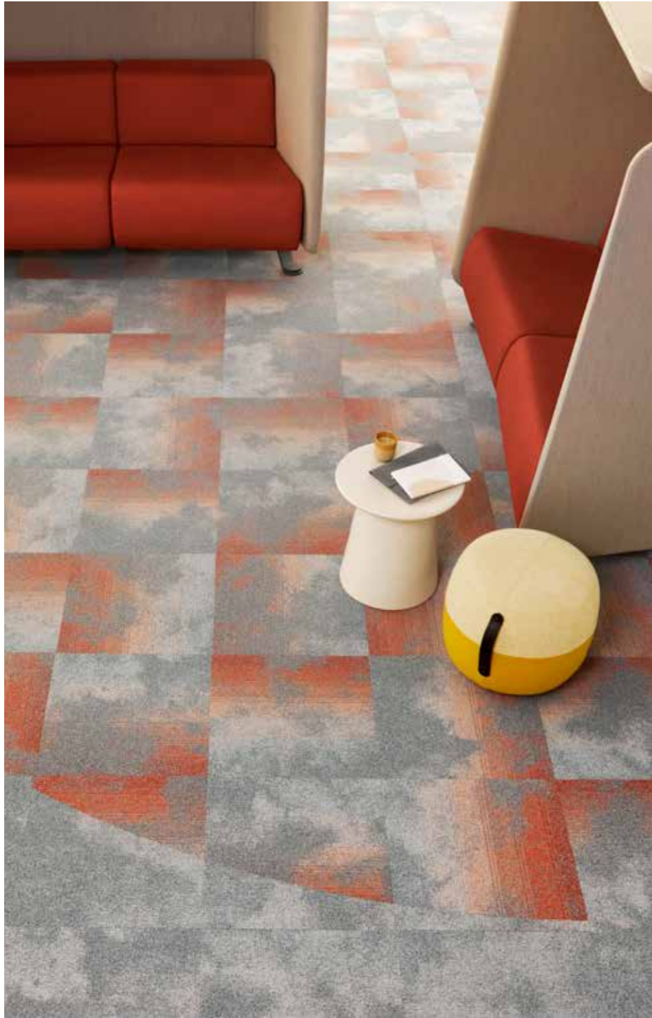
Serene 9950, Serene Colour 5031