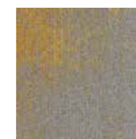
Serene Colour 6113