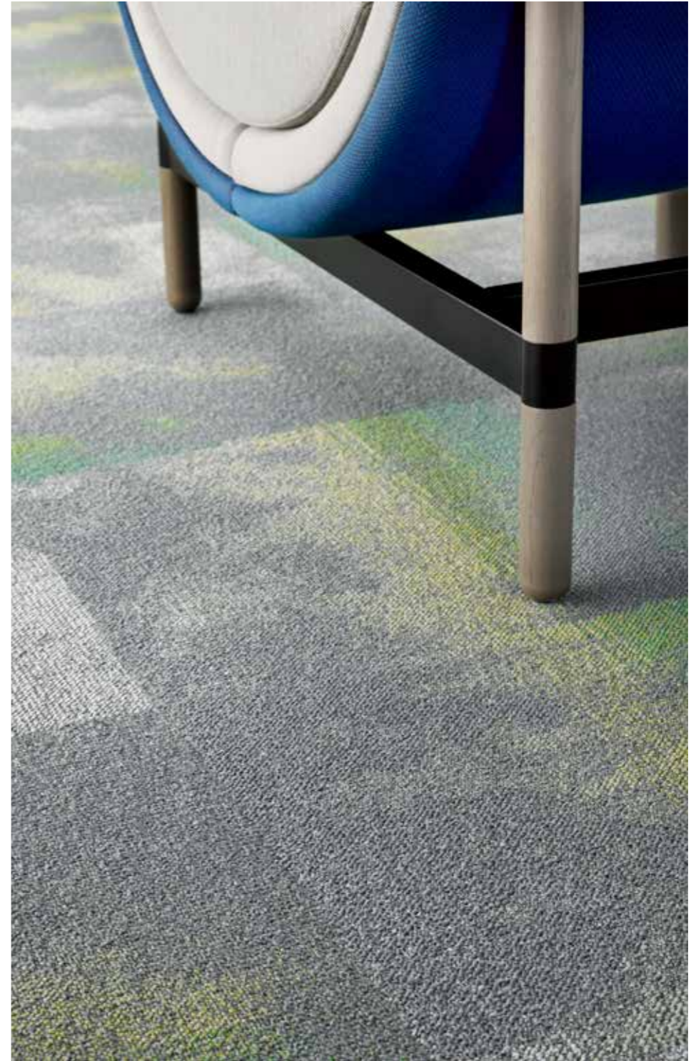
Serene Colour 7373